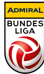
Bewerbslogo höchste Spielklasse