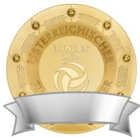
Keine zusätzlichen Elemente