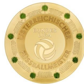
Keine illustrativen Zusatzeffekte