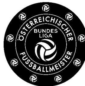
Admiral Bundesliga Piktogramm