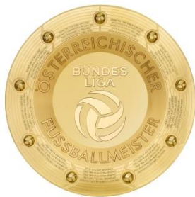
Admiral Bundesliga Fotografie