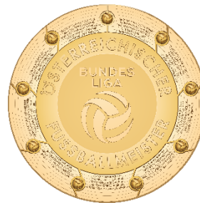
Admiral Bundesliga Illustration detailliert